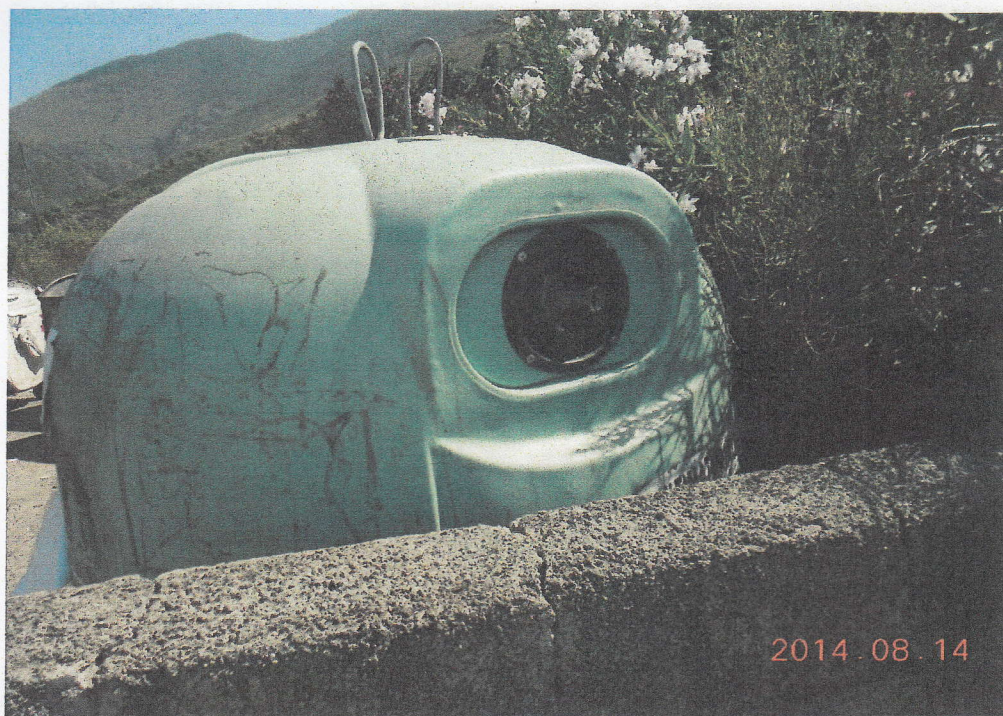
Foto N 5 – Campana per Vetro e Plastica all'ingresso stracolma, non vuotata da mesi