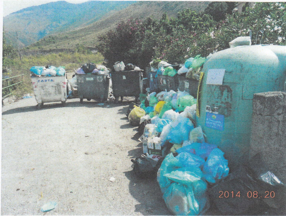
Foto N 8 – Situazione postazione all'ingresso davanti ai cassoni al 20/08. Il foglio bianco sulla campana dice " Non buttare a terra la spazzatura" !!!