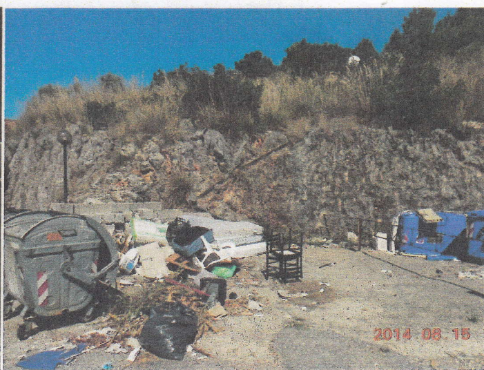
Foto N 3 - All'ingresso del Villaggio al 14/08 . Foto N 4 - Situazione alla postazione alta al 15/08