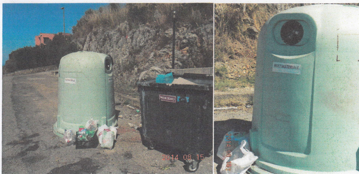
Foto NN 6-7 – Campana per Vetro e Plastica postazione in alto stracolma, non vuotata da mesi