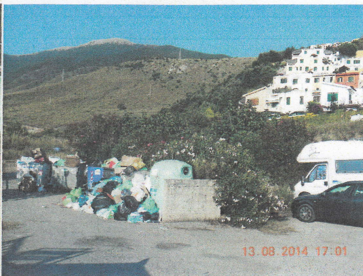
Foto NN 1-2 - Situazioni all'ingresso del Villaggio del Bridge verificatesi per molti giorni consecutivi e in tante riprese a partire da giugno a metà agosto. 13/08/2014