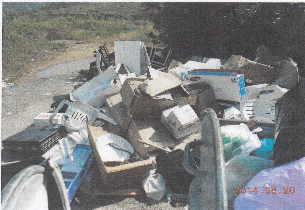
Foto N 9 - Situazione postazione all'ingresso dietro ai cassoni al 20/08.