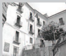
Il Comune di Belvedere

labrese. Al commissario Musi va riconosciuto, di aver voluto da subito porre al centro dell'azione di rinnovamento del partito il contributo apportato dai territori, dai tanti amministratori che con successo governano numerose realtà locali. Un'azione che ha avuto modo di attuarsi attraverso diversi incontri che Lo stesso sen. Musi, così come il coordinatore provinciale, Bruno Villella, hanno già avuto con i sindaci. Un continuo interscambio che testimonia ulteriormente la volontà, da parte del commissario del Pd calabrese, di voler proseguire con forza nell'azione di rinnovamento del partito».