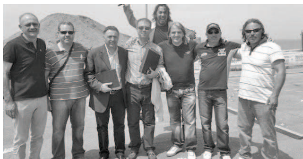
Gli organizzatori del motoraduno "Città di Scalea"